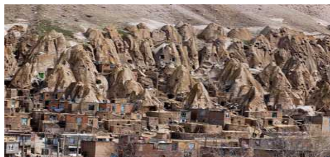
تصویر ۱: روستای کندوان، معماری صخره‌های