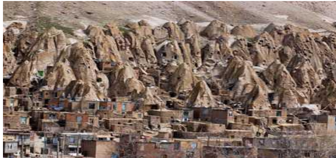
تصویر ۱: روستای کندوان، معماری صخره‌ای